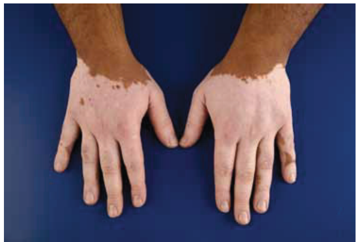
Figuur 1. Niet-segmentale vitiligo.