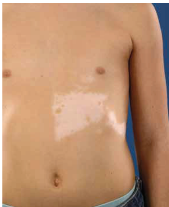
Figuur 2. Segmentale vitiligo.